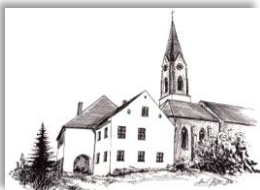
Mariä Himmelfahrt Atting