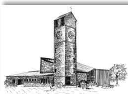
Verklärung Christi Rain