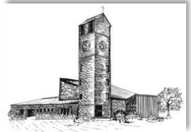
Verklärung Christi Rain