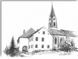
Mariä Himmelfahrt Atting