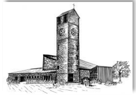
Verklärung Christi Rain