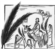
Im Schatten des Jubels