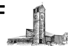
Rain - Verklärung Christi